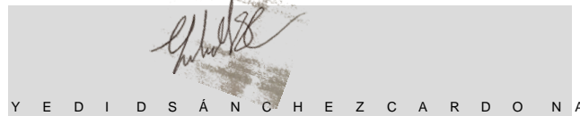
Nombre y firma de la persona integrante del Comité de Contraloría Social que entrega este Informe