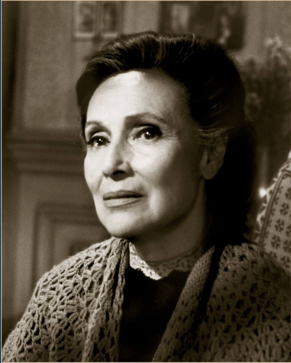
S/T, Fondo Dolores del Río, Álbum 11021. SECRETARÍA DE CULTURA-CINETECA NACIONAL.