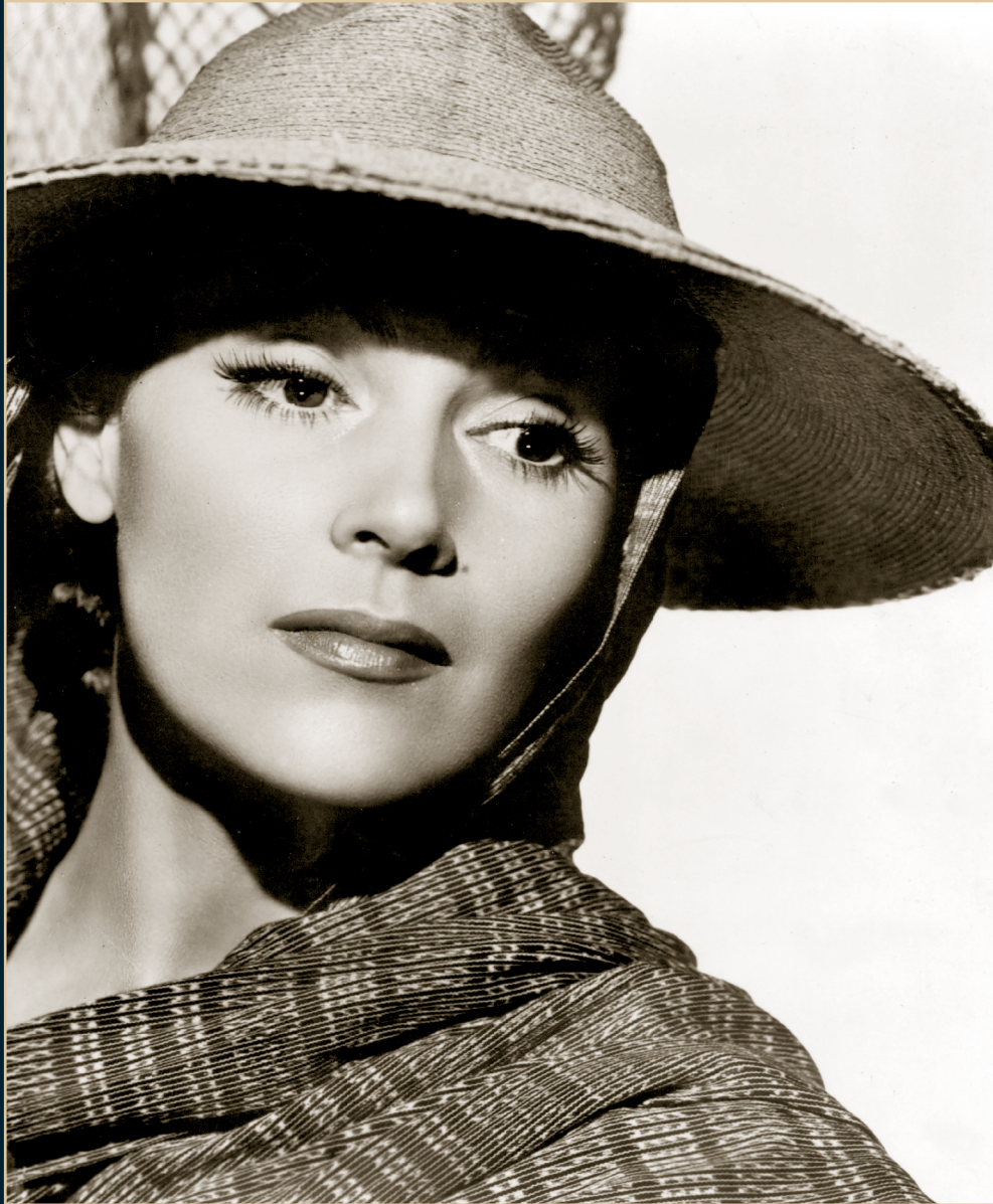
Dolores del Río, María Candelaria, 1943.