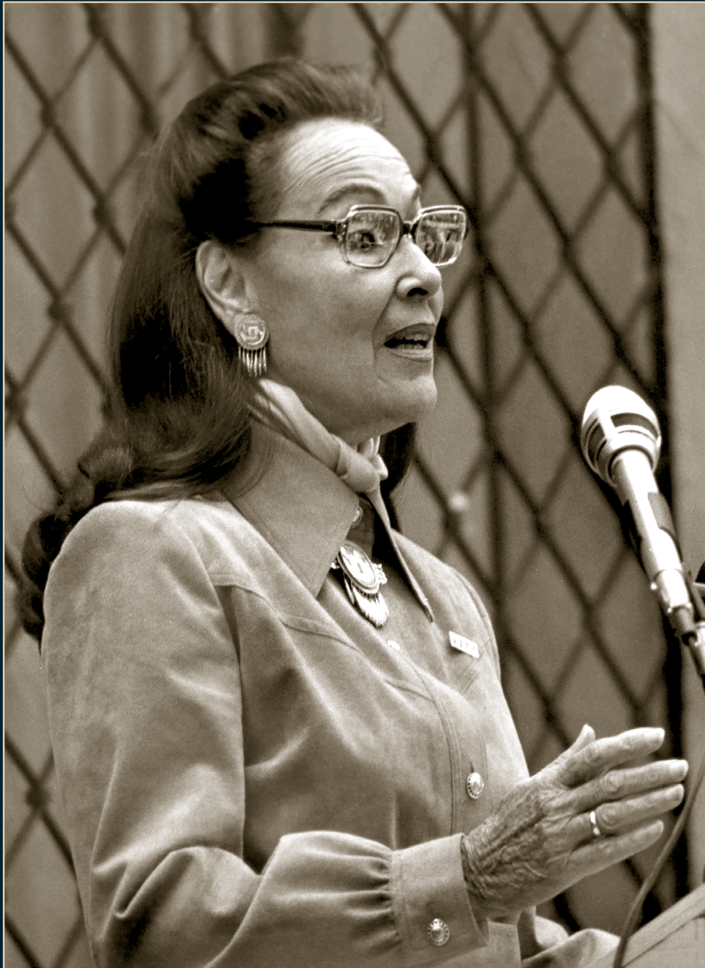
Dolores del Río. 13 de noviembre de 1975.