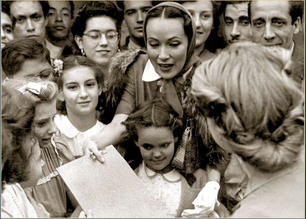
Dolores del Río, recibiendo del Instituto "Luis Vives" fotografías del Colegio, 28 de octubre de 1979.