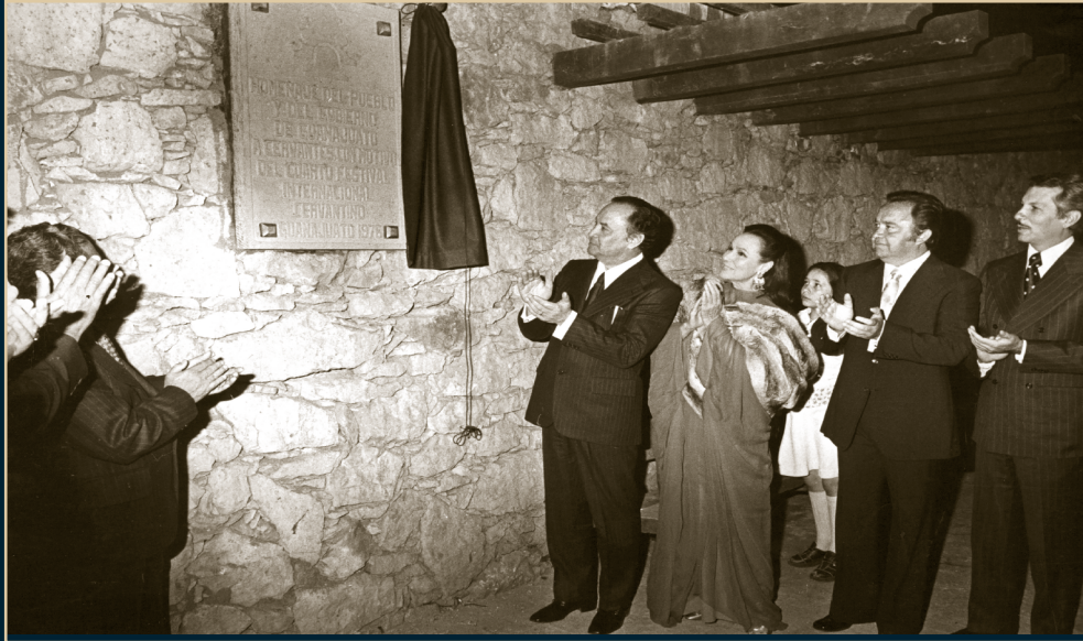
S/T. 30 de abril, Guanajuato.