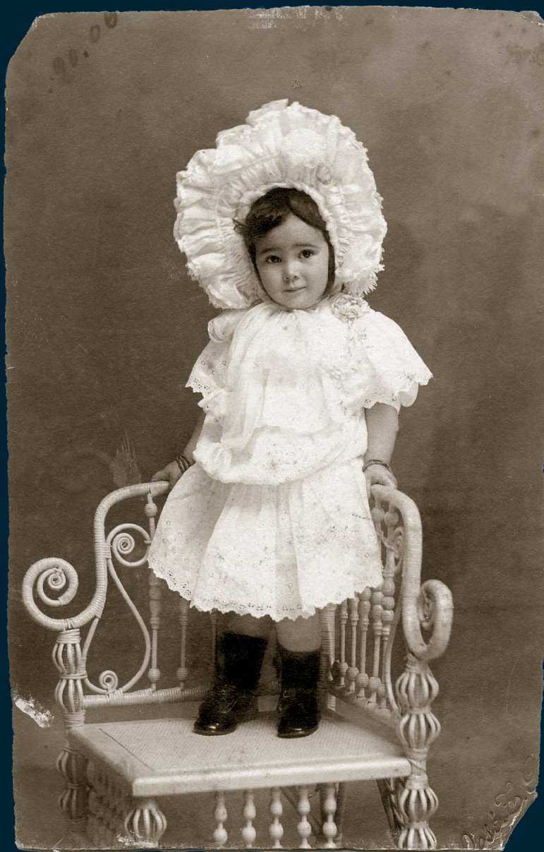
Dolores Asúnsolo López Negrete. No. Fondo: MXXIV-3. Fondo: Dolores del Río. Clasificación 090: MXXIV-3.1.7. Año: 1904-1923. Durango, s/f. Serie: Fotografías.