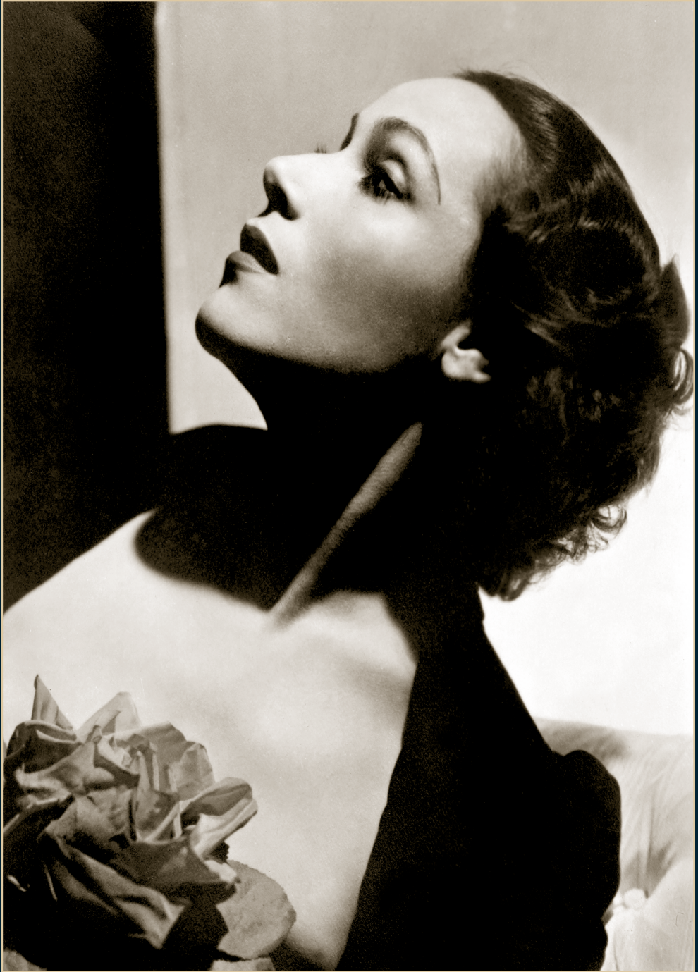
Dolores del Río, ca. 1935.