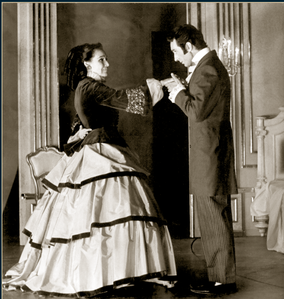
Dolores del Río, acompañada de Germán Robles de una escena de la pieza teatral La Dama de las Camelias. 13 de abril de 1983.