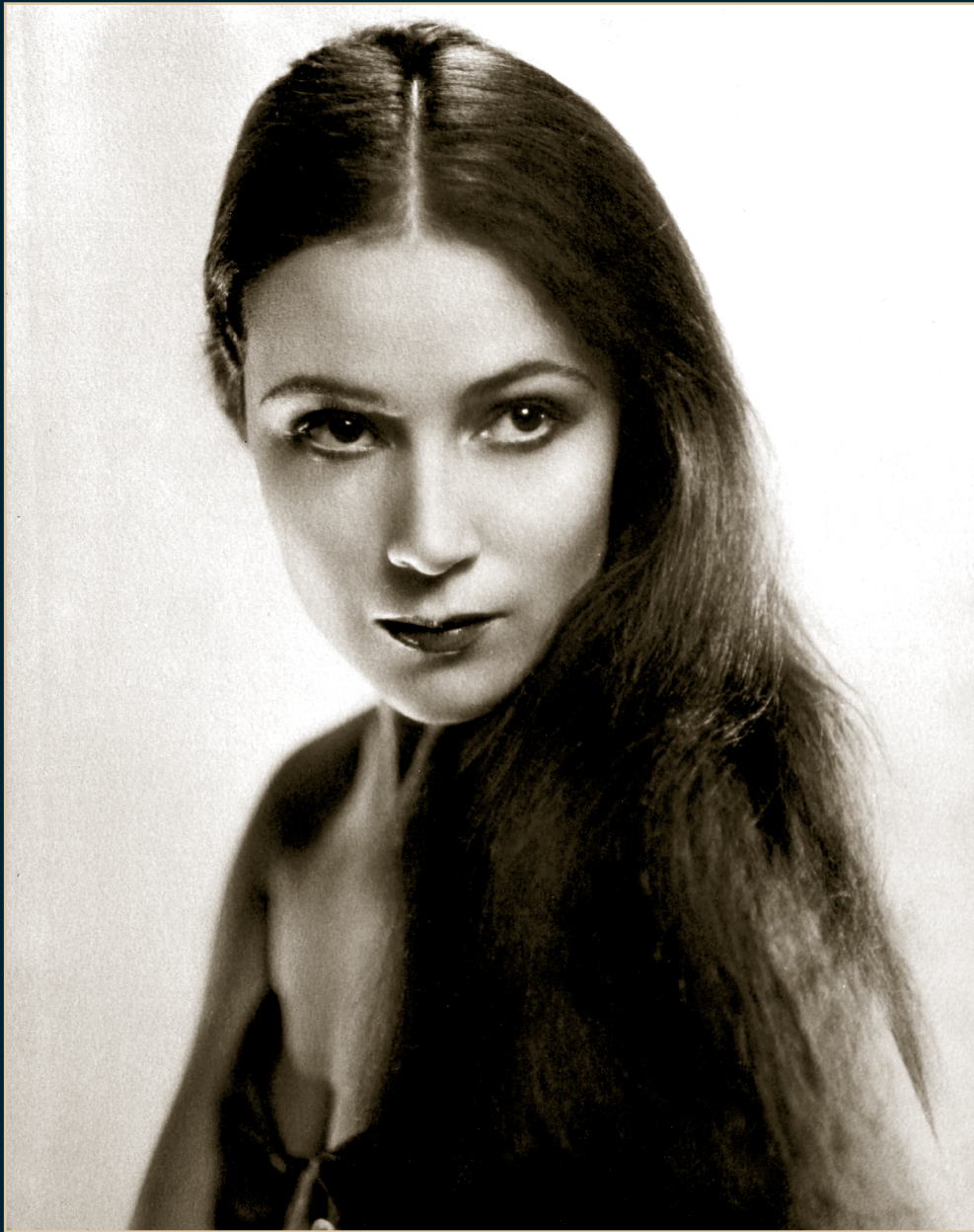
Dolores del Río, en la película La senda del 98 o Cenizas de gloria... No. Fondo: MXXIV-3. Fondo: Dolores del Río. Clasificación 090: MXXIV-3.5.554. Año: 1927-1928. S/1, 1928. Serie: Fotografías. CEHM-Carso.