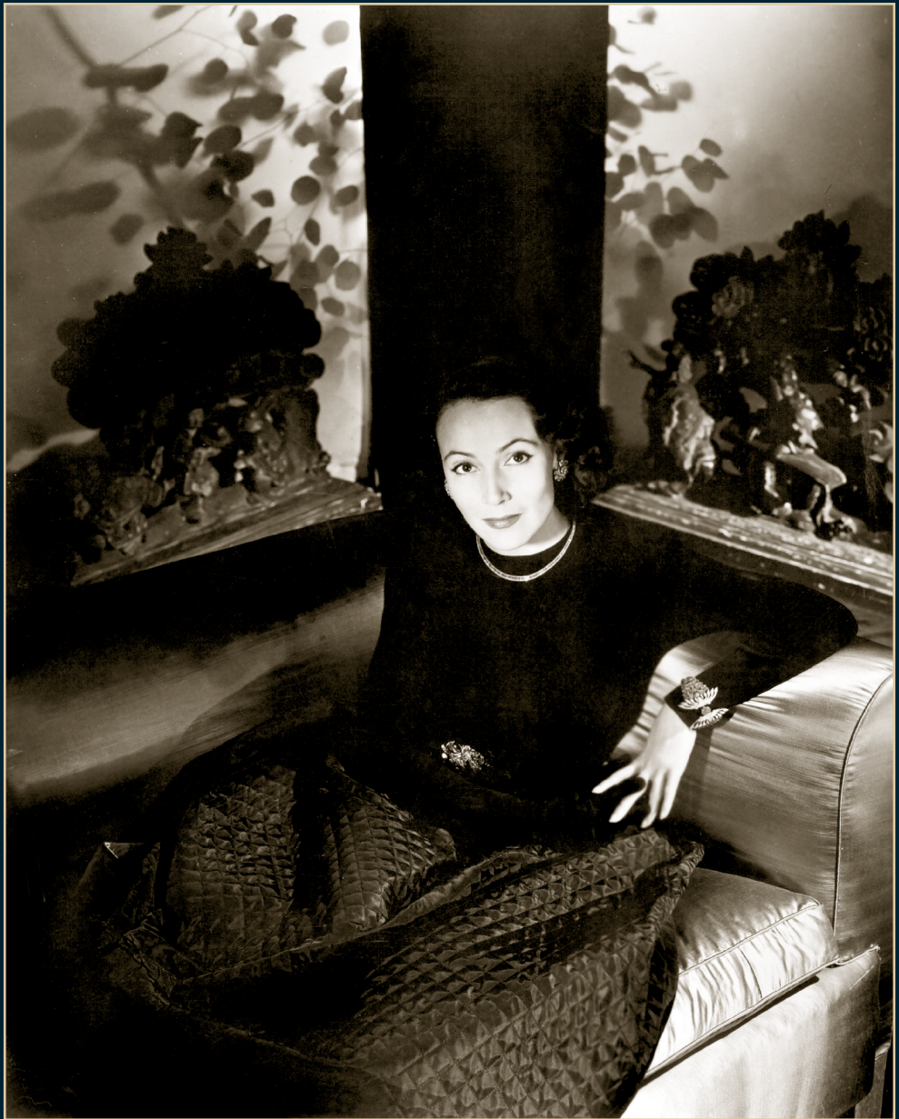
Dolores del Río, ca. 1955.