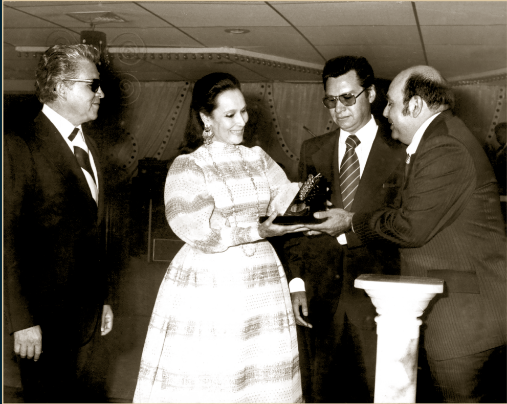
Momentos. 2 de junio de 1976.