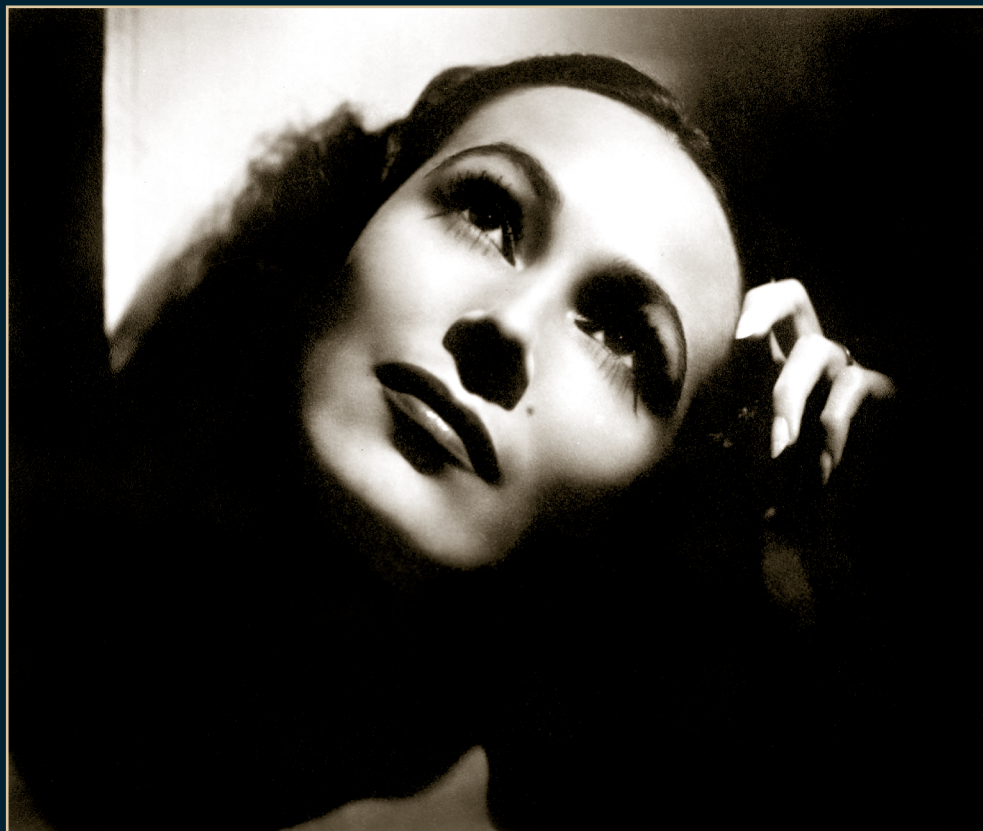
Dolores del Río. 22 de abril de 1936.