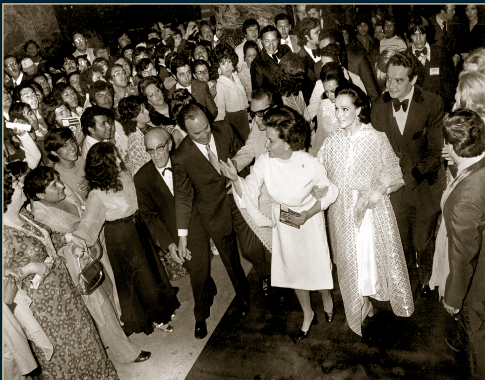
S/T. 28 de junio de 1979.