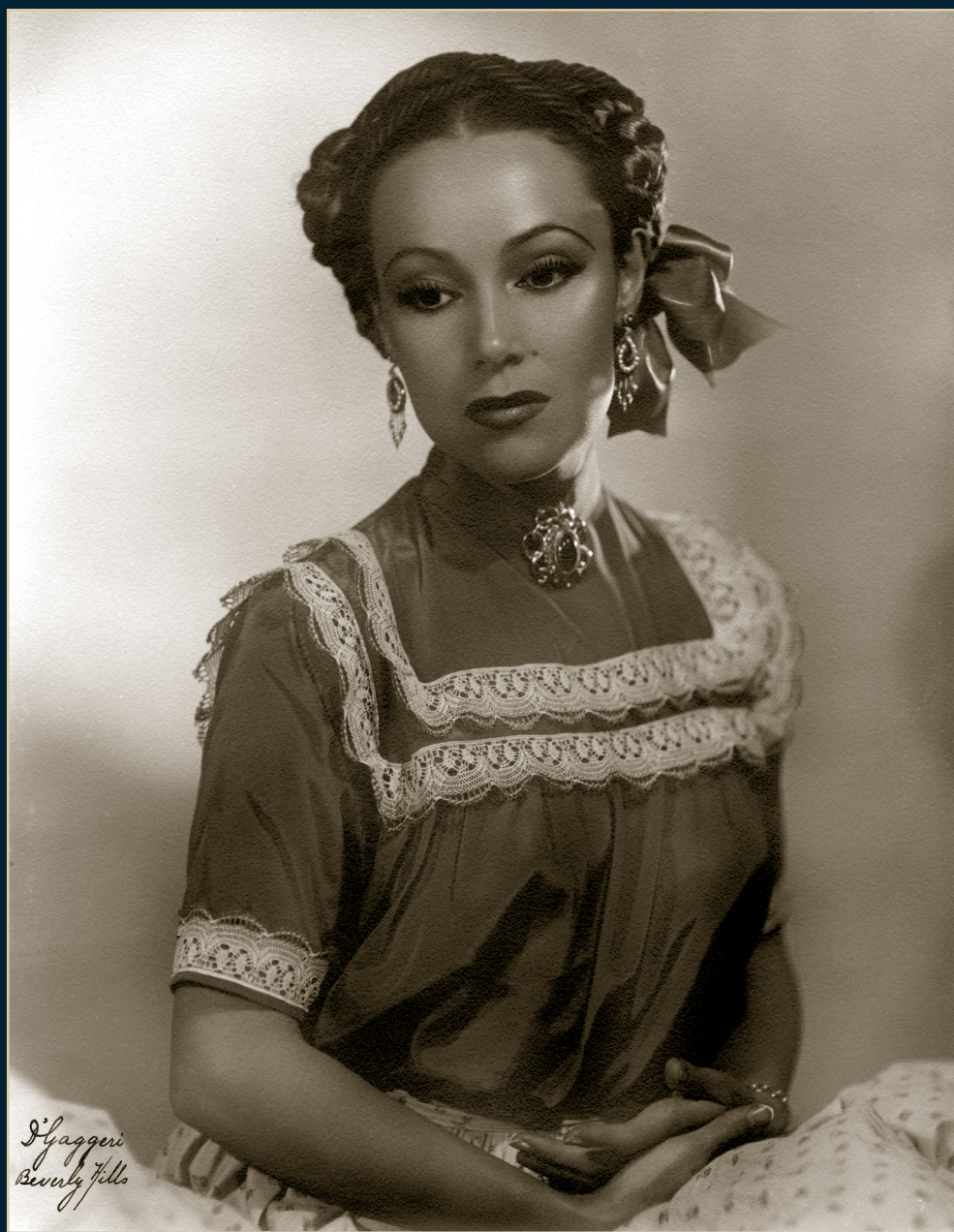
Dolores del Río con un peinado inspirado en Oaxaca. No. Fondo: MXXIV-3. Fondo: Dolores del Río. Clasificación 090: MXXIV-3.10.1104. Año: 1936-1938. S/1, 1938. Serie: Fotografías. CEHM-Carso.