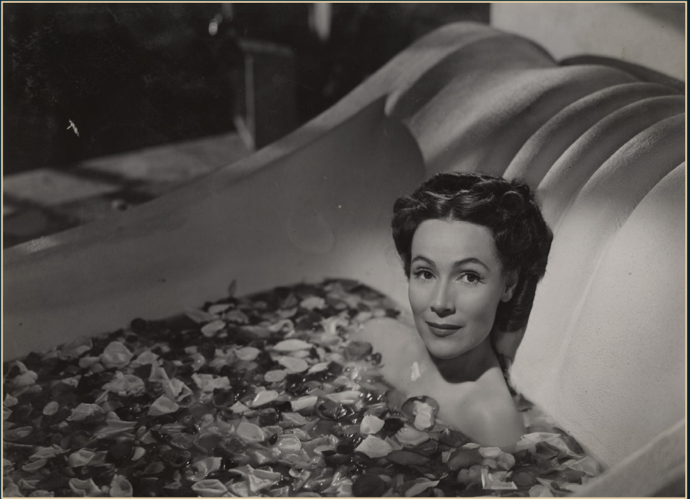
S/T, Fondo Dolores del Río, Álbum 11026. SECRETARÍA DE CULTURA-CINETECA NACIONAL.