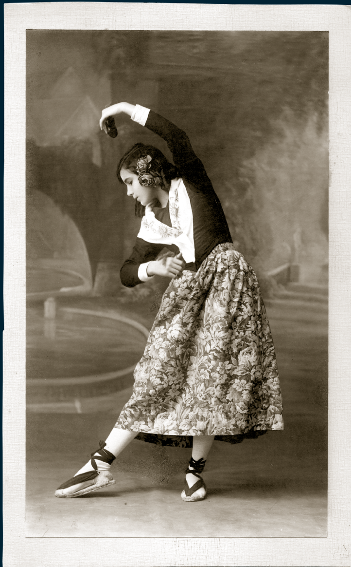
Dolores Asúnsolo López Negrete, vestida de "Española" en su clase de danza. No. Fondo: MXXIV-3. Fondo: Dolores del Río. Clasificación 090: MXXIV-3.1.30. Año: 1904-1923. S/1, 1918. Serie: Fotografías.