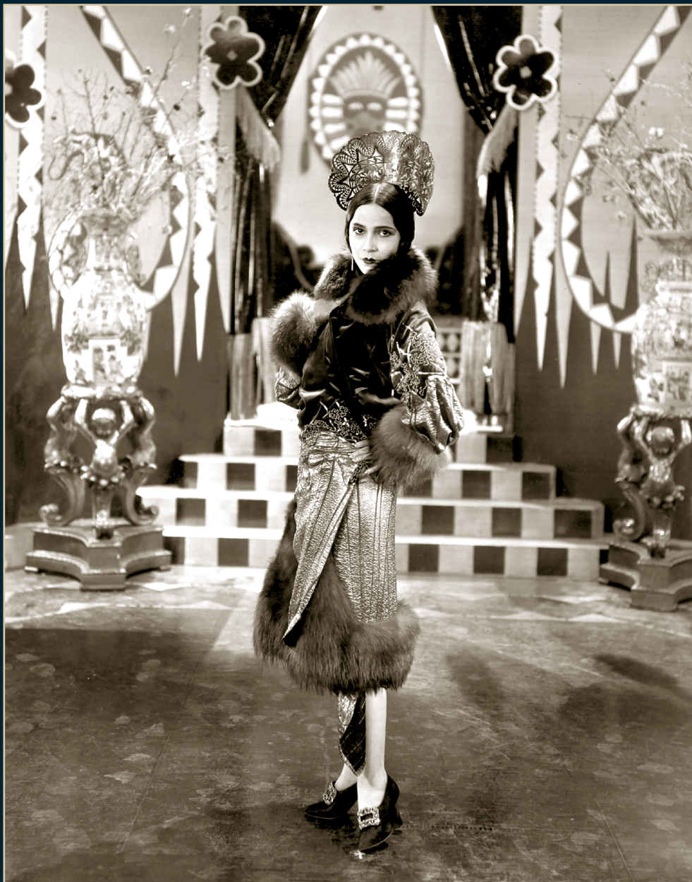
S/T, Fondo Dolores del Río, Álbum 1107, 1931, SECRETARÍA DE CULTURA-CINETECA NACIONAL.