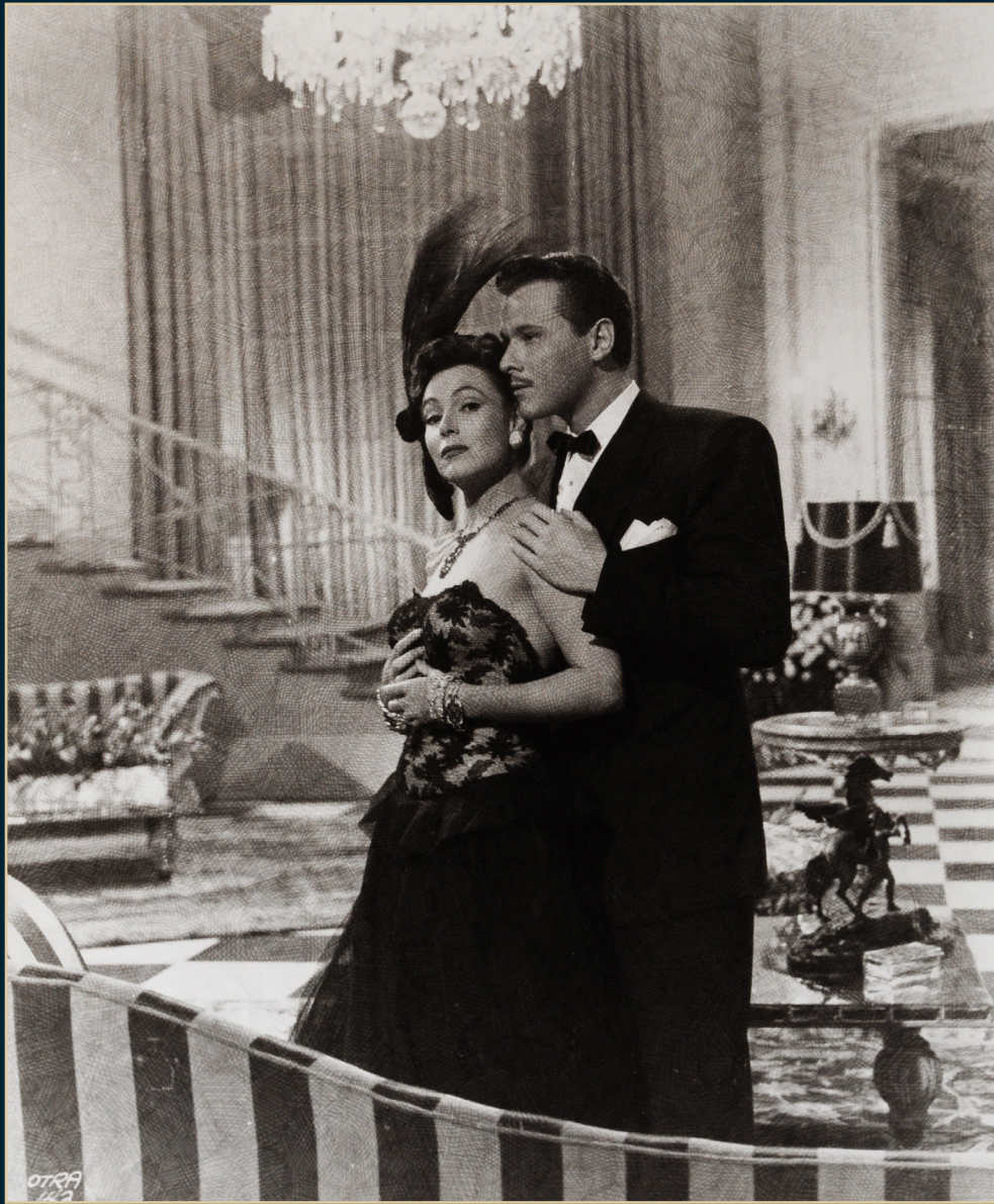
"La Otra", Fondo Dolores del Río, Archivo: FNH-0276-003. SECRETARÍA DE CULTURA-CINETECA NACIONAL.