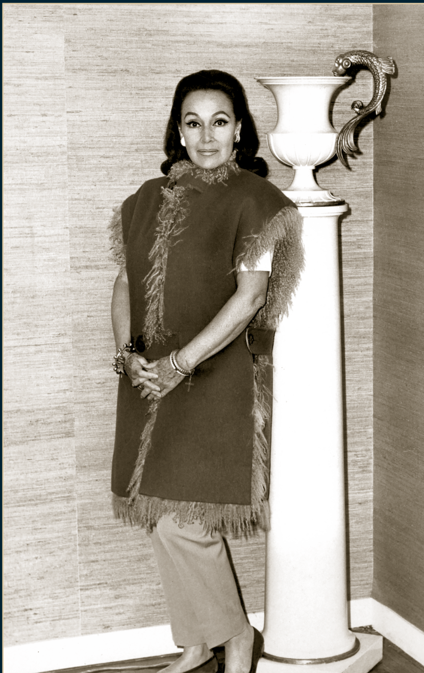
Dolores del Río, mayo de 1983.