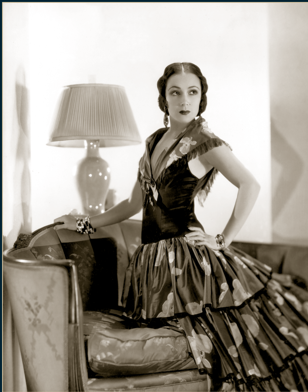
S/T, Fondo Dolores del Río, Álbum 1107, 1931, SECRETARÍA DE CULTURA-CINETECA NACIONAL.