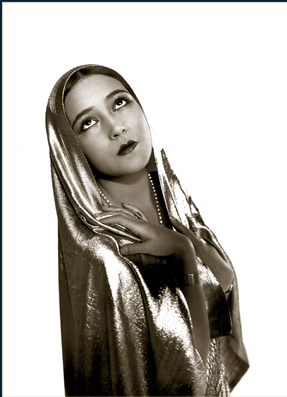
Dolores del Río. No. Fondo: MXXIV-3. Fondo: Dolores del Río. Clasificación 090: MXXIV-3.2.250. Año: 1923-1926. S/l, 1924. Serie: Fotografías.