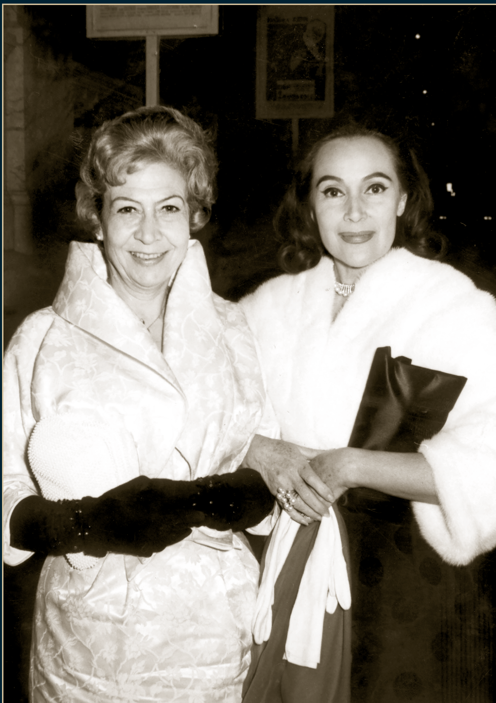
Dolores del Río en el XXIV Festival de San Sebastián. No. Fondo: MXXIV-3. Fondo: Dolores del Río. Clasificación 090: MXXIV-3.24.2337, S/L. Año: 1976-1980. Serie: Fotografías. CEHM-Carso.