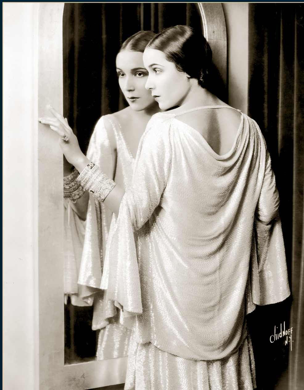
S/T, Fondo Dolores del Río, Álbum 1107, 1929, SECRETARÍA DE CULTURA-CINETECA NACIONAL.