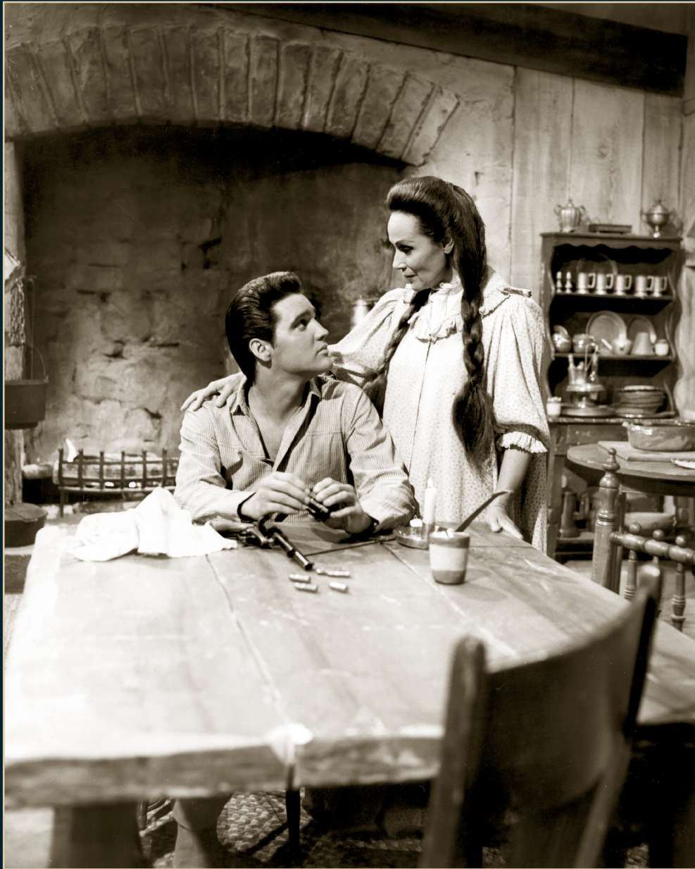
Dolores del Río y Elvis Presley en escena de la película ( Flaming Star ) Estrella de fuego . No. Fondo: MXXIV-3. Fondo: Dolores del Río. Clasificación 090: MXXIV-3.17.1760. Año: 1958-1962. S/1, 1924. Serie: Fotografías. CEHM-Carso.