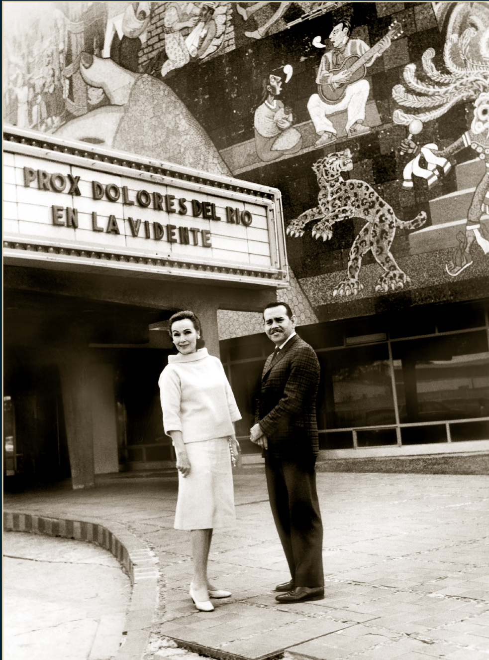
S/T, Fondo Dolores del Río, Álbum 11021, 1959, SECRETARÍA DE CULTURA-CINETECA NACIONAL.