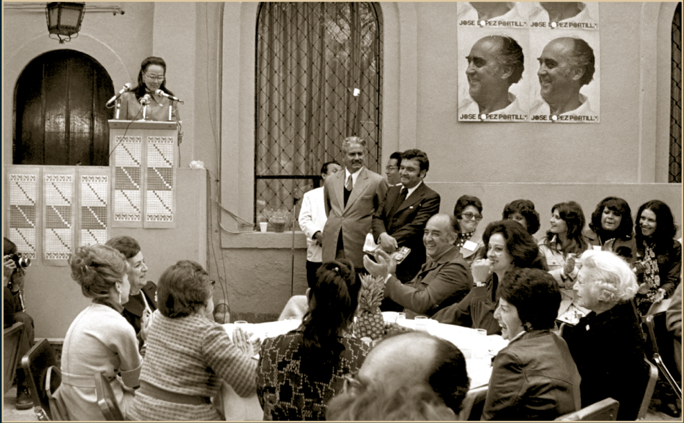
Dolores del Río. 13 de noviembre de 1975.