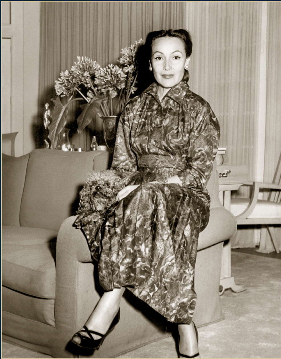
Dolores del Río. Actriz.