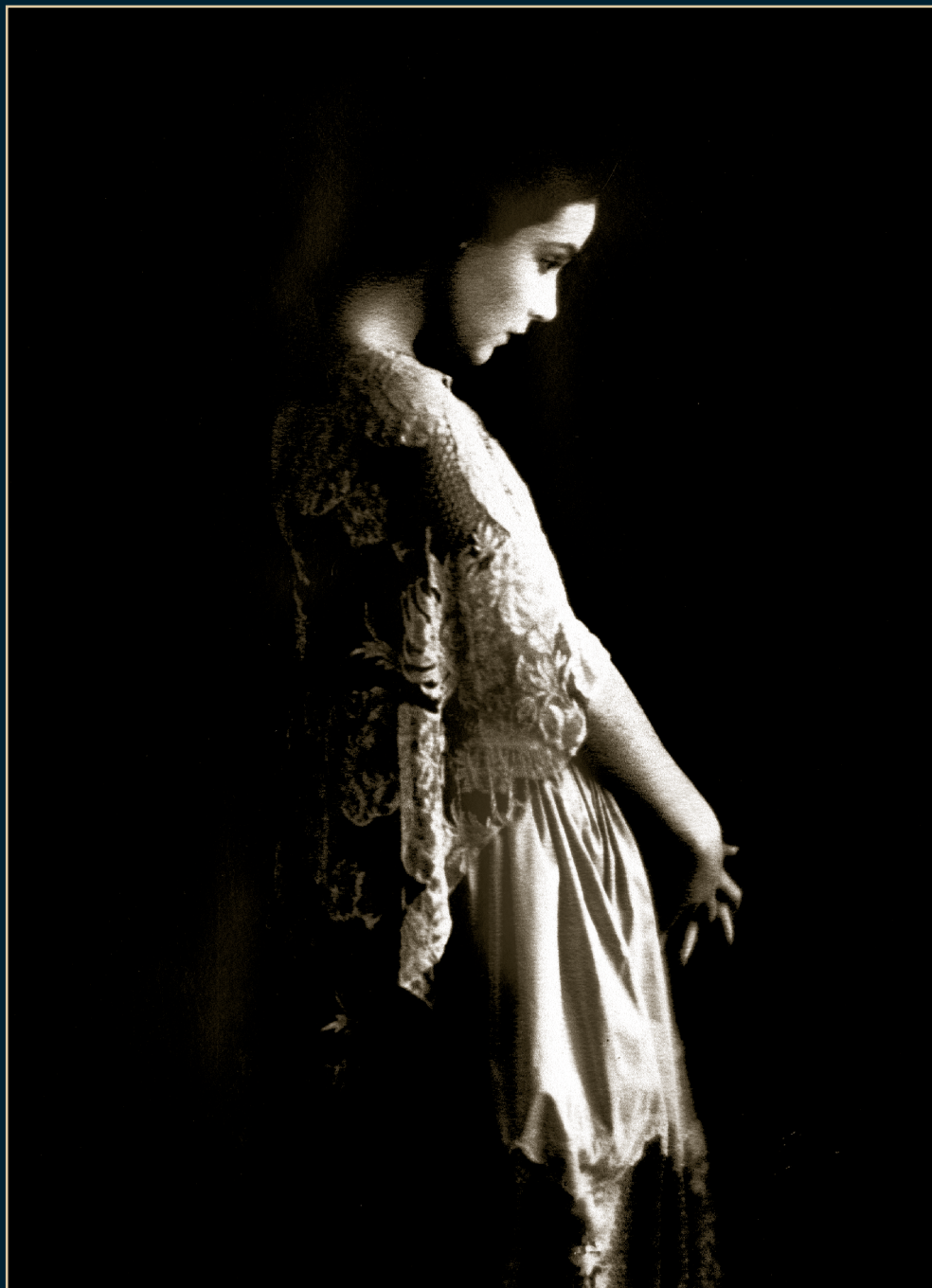
S/T, Fondo Dolores del Río, Álbum 11021, 1919, SECRETARÍA DE CULTURA-CINETECA NACIONAL.