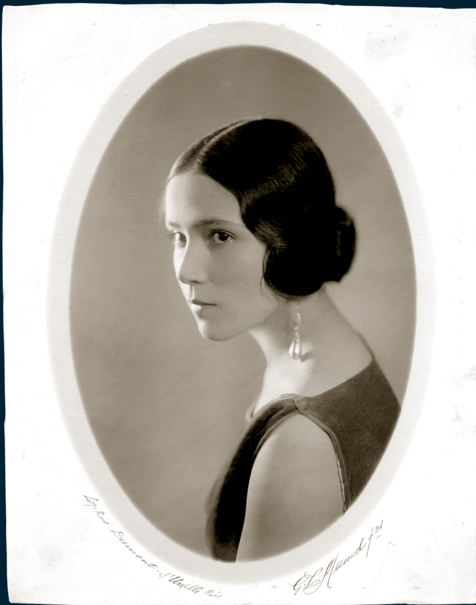
Dolores Asúnsolo López Negrete. No. Fondo: MXXIV-3. Fondo: Dolores del Río. Clasificación 090: MXXIV-3.1.54. Año: 1904-1923. S/1, 1920. Serie: Fotografías. CEHM-Carso.