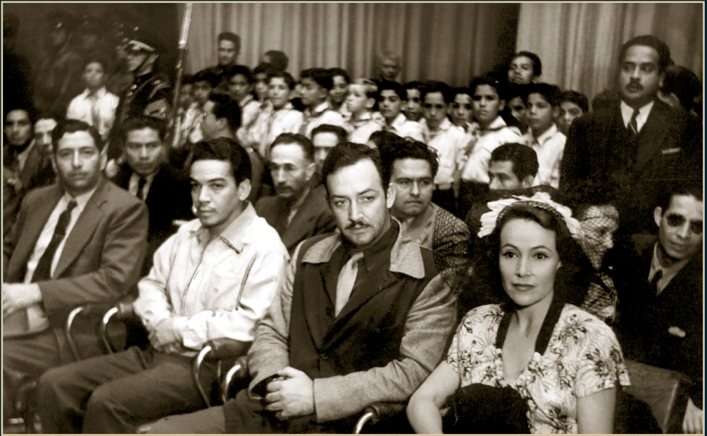
Dolores del Río (a su lado Jorge Negrete y Mario Moreno "cantinflas"). 1945.