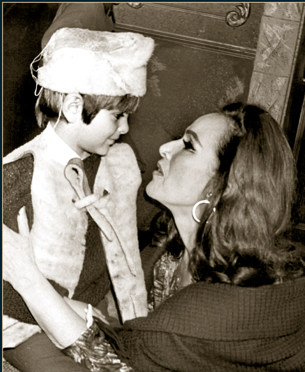
Dolores del Río. Escena de La Reina y los Rebeldes, 9 de octubre de 1967.