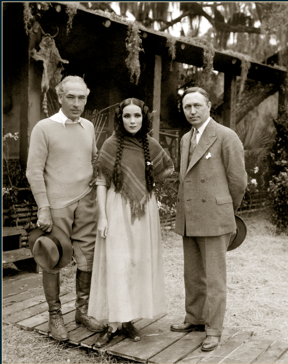
Edwin Carewe, Dolores Del Río. Evangelina. No. Fondo: MXXIV-3. Fondo: Dolores del Río. Clasificación 090: MXXIV-3.6.649. Año: 1928-1929. S/1, 1929. Serie: Fotografías.