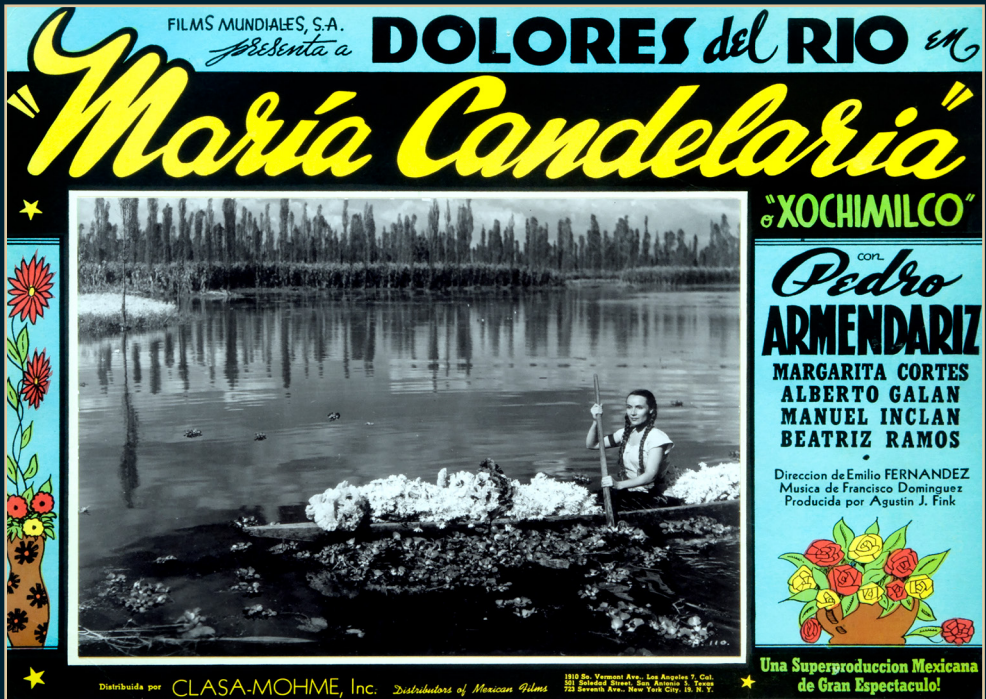
"María Candelaria", Fondo Dolores del Río, Archivo: FNH-0062-001. SECRETARÍA DE CULTURA-CINETECA NACIONAL.