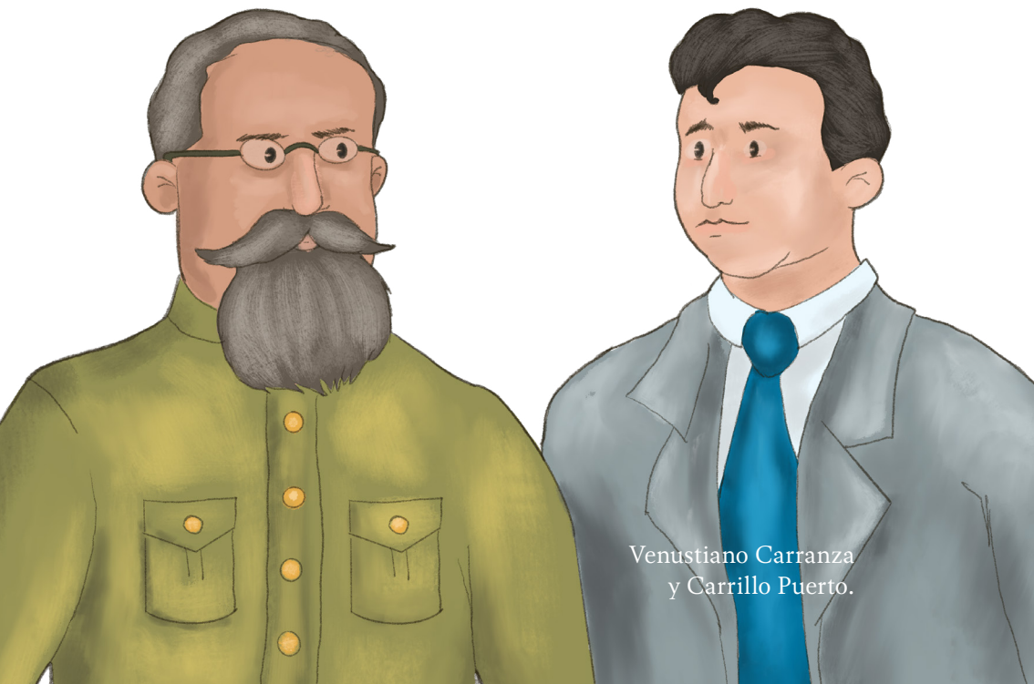
Venustiano Carranza y Carrillo Puerto.

Así es. Desde la prisión, Felipe pidió hablar con Salvador Alvarado, quien aceptó la reunión. En esa entrevista, se dieron cuenta de que tenían mucho en común. Los dos eran revolucionarios; querían hacer grandes cambios en favor de los más pobres, querían ayudar a los indígenas, a los trabajadores y a las mujeres; también pretendían acabar con el poder de la Casta Divina y hacer que la educación fuera un motor para el cambio del país.