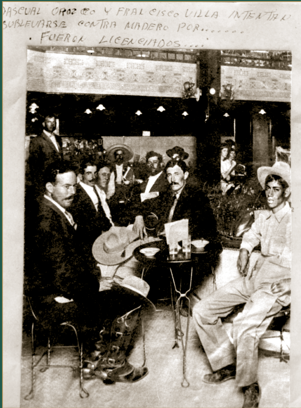
Villa y Orozco en una fuente de sodas en El Paso, Texas. Reprografía. 1911.

© (33432) SECRETARÍA DE CULTURA. INAH. SINAFO. FN. MX.