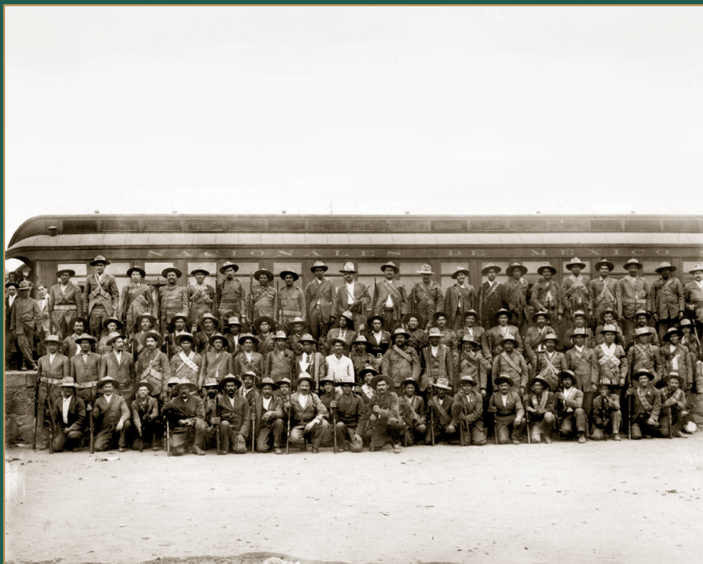
Francisco Villa y sus "Dorados" en Aguascalientes. 28 de octubre de 1914.