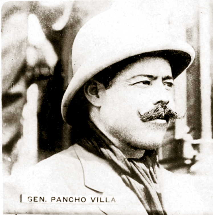
GEN. PANCHO VILLA