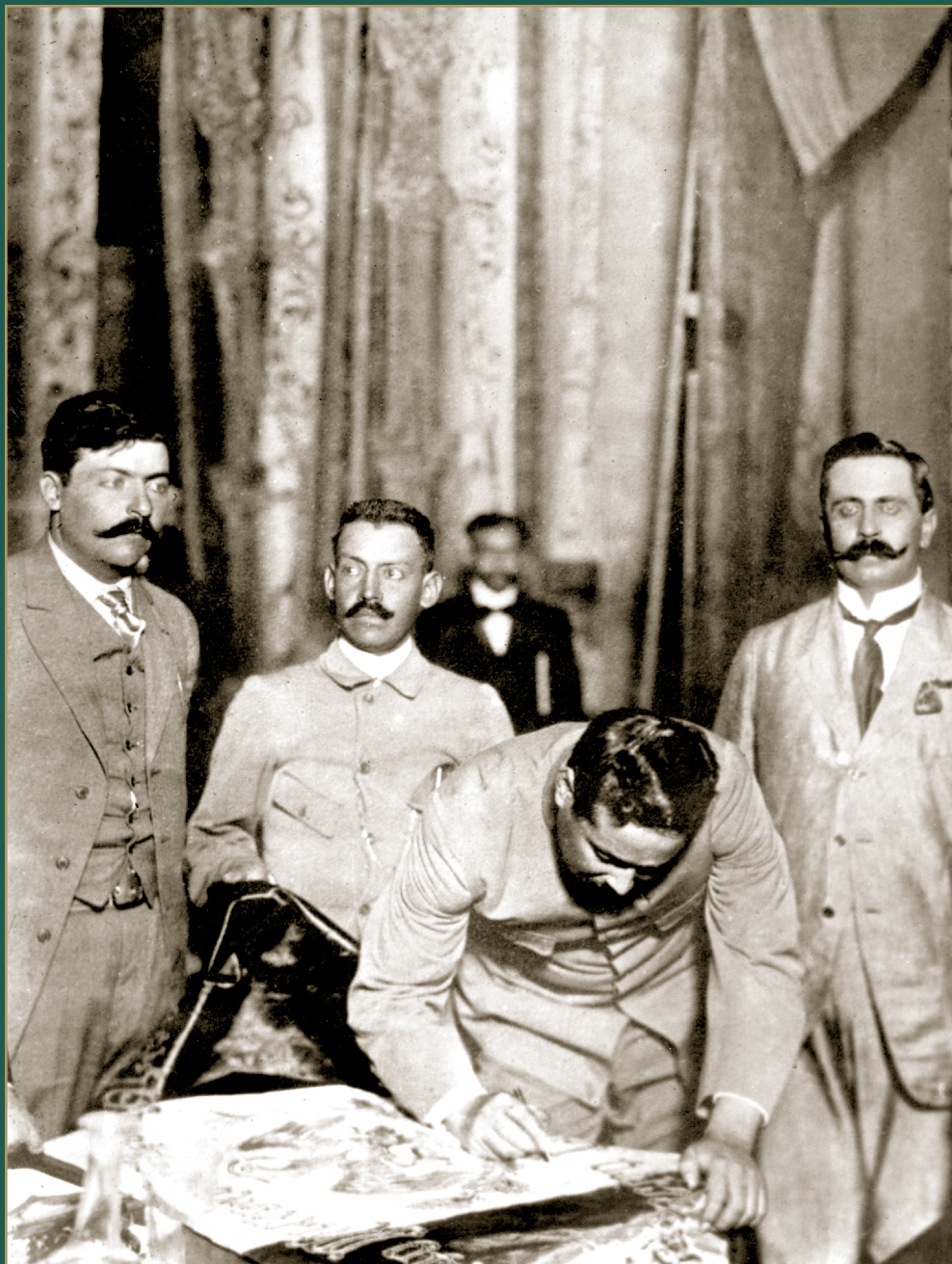
Francisco Villa asistió a la Soberana Convención Revolucionaria en Aguascalientes. La asamblea decidió destituir a Villa y a Carranza de sus cargos. Villa aceptó, pero Carranza no. Francisco Villa firma la bandera convencionista. 19 de octubre de 1914.