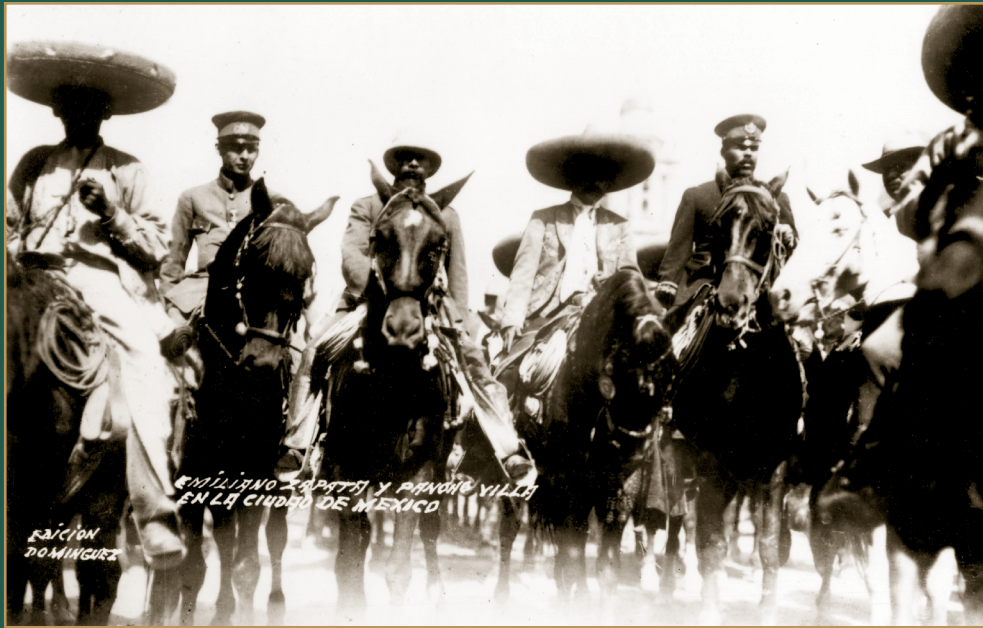
El 4 de diciembre de 1914, Francisco Villa y Emiliano Zapata se reunieron en Xochimilco para firmar un pacto de colaboración entre ambas fuerzas. Dos días después, el 6, ambos ejércitos entraron triunfantes a la capital.