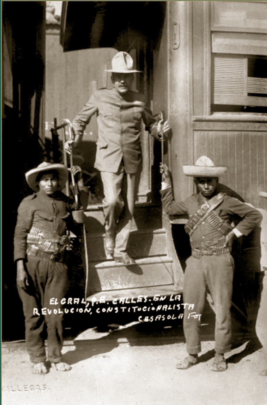
Calles durante la campaña contra maytorenistas y villistas en 1915.