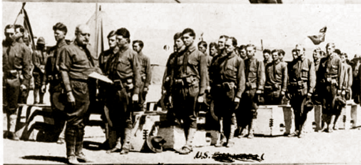
GEN. PANCHO VILLA RAID ON COLUMBUS, NEW MEXICO, MARCH 9TH, AT 4 A. M., 1916. ALSO U. S. SOLDIERS KILLED IN THE RAID. THE BODIES ARE READY FOR SHIPMENT HOME. VILLA KILLED MEN AND WOMEN AND BURNED THE TOWN. U. S. SOLDIERS ROUTED HIM, KILLING 200 OF HIS BANDITS, BURNING THEIR BODIES. NO. 715