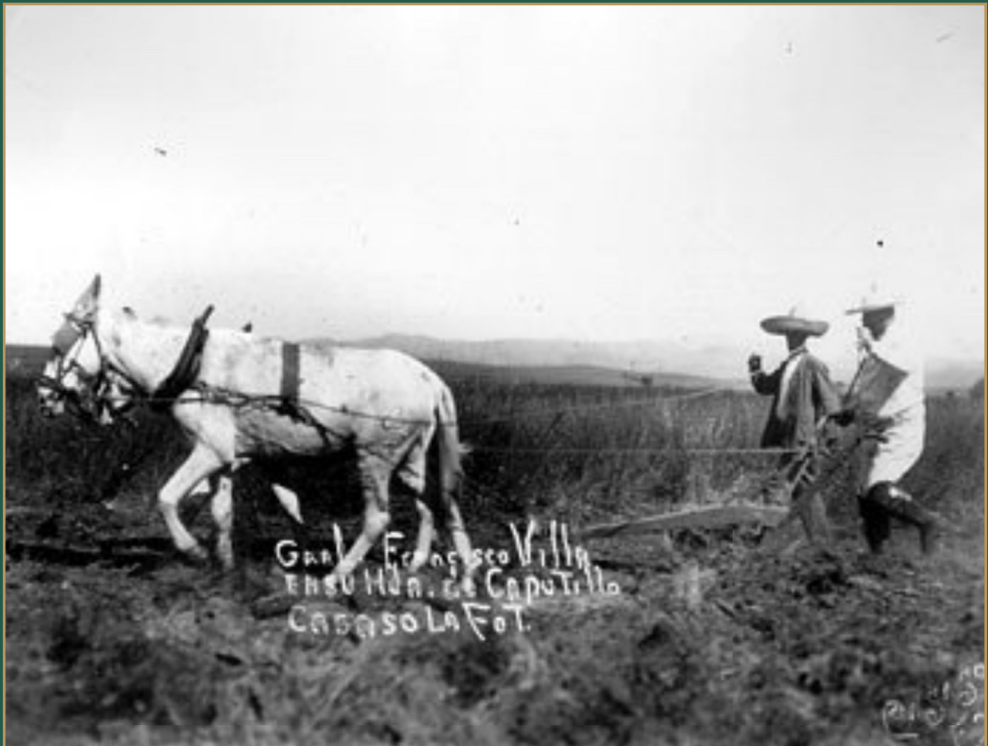
Francisco Villa trabaja con el arado en su hacienda de Canutillo. 1920.